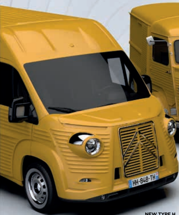
NEW TYPE H

Aujourd'hui, notre TYPE H basé sur le Jumper est rejoint par un modèle plus petit, le TYPE HG, basé sur le Citroën Jumpy/SpaceTourer pour répondre aux besoins des clients qui recherchent un véhicule personnalisé avec une attention particulière aux détails.