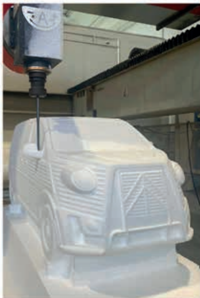
FABRIZIO CASELANI IDEATEUR ET CONSTRUCTEUR

TYPE H et TYPE HG représentent la fusion de l'évocation directe de ses prédécesseurs avec la technologie contemporaine et la fiabilité de la nouvelle gamme Citroën Jumper, Jumpy et SpaceTourer.