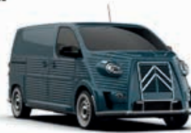
WEEK-END BLUE AC 625 - Pastel

* : Uniquement avec un véhicule de base de la même couleur