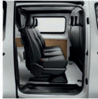
CABINE APPROFONDIE MOBILE