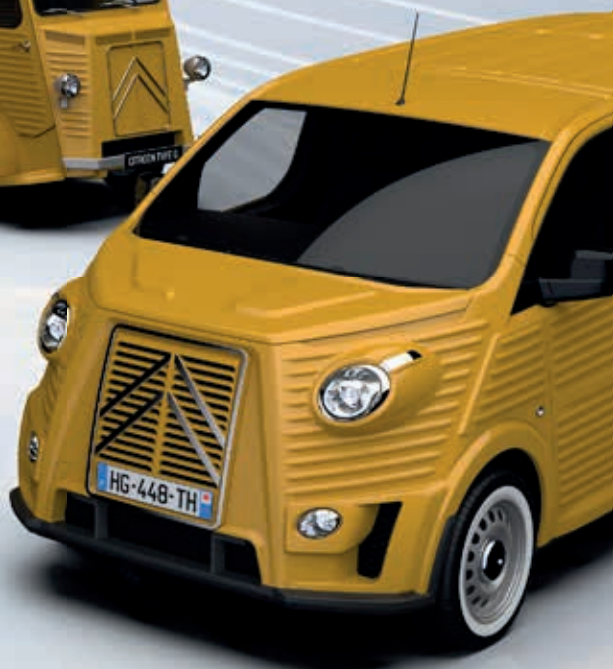
NEW TYPE HG