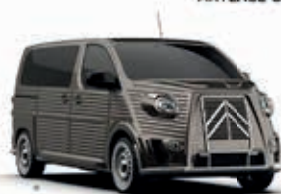
RICH OAK BROWN - Metallic