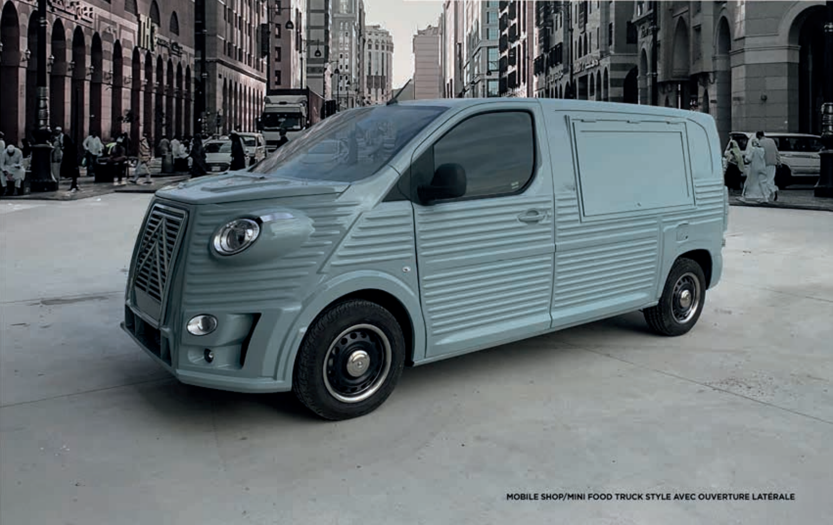
MOBILE SHOP/MINI FOOD TRUCK STYLE AVEC OUVERTURE LATÉRALE