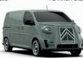
GIADA GREEN AC 539 - Pastel