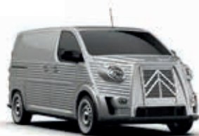
ARTENSE GREY - Metallic