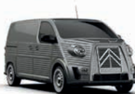
PLATINUM GREY - Metallic